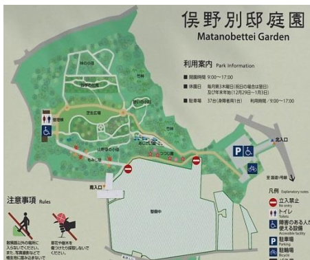
俣野別邸庭園マップ