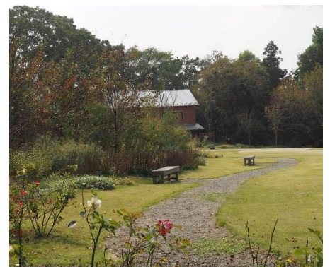
管理棟と芝生広場