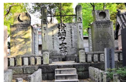
富岡八幡宮相撲碑