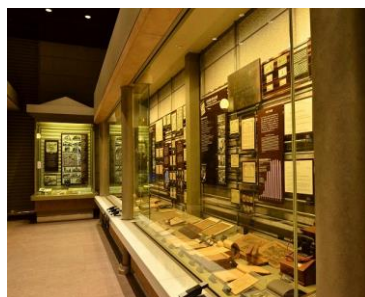
東京証券取引所資料室