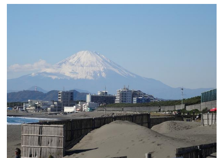
サザンビーチより富士山を見る