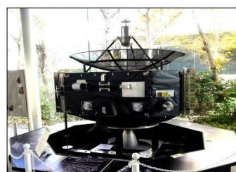
火星探査機 のぞみ