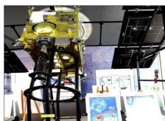
小惑星探査機 はやぶさ