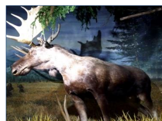
ヘラジカのジオラマ