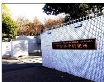
宇宙科学研究所入口

散策ルート ：淵野辺駅南口より神奈中バス停2番乗り場 10:50 発→10分後宇宙科学研究本部下車→徒歩5分 JAXA 11:20~12:20→徒歩8分相模原市立博物館 12:30~14:30→模原市立博物館バス停から 14:38 発に乗車→淵野辺駅南口 14:50 頃到着 米 時刻はあくまで予定です