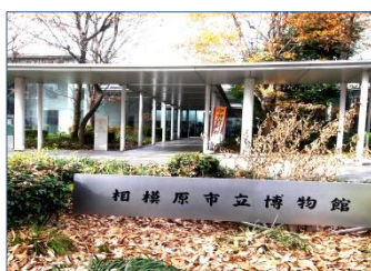
相模原市立博物館