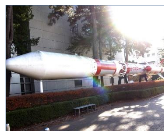
M-3S II 型ロケット