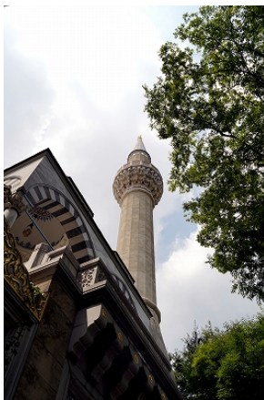
東京ジャミー外観