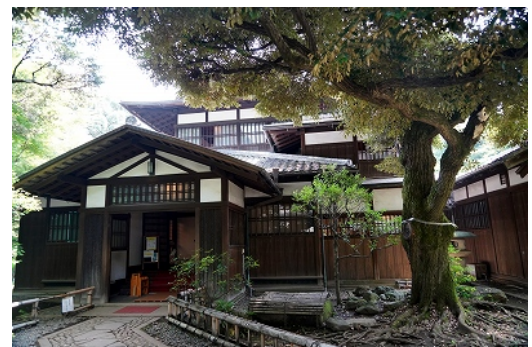
前田侯爵邸和山館