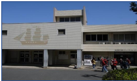
浦賀コミュニティセンター