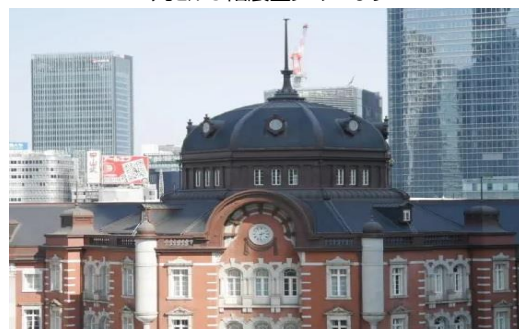
丸ビル5階展望フロアより