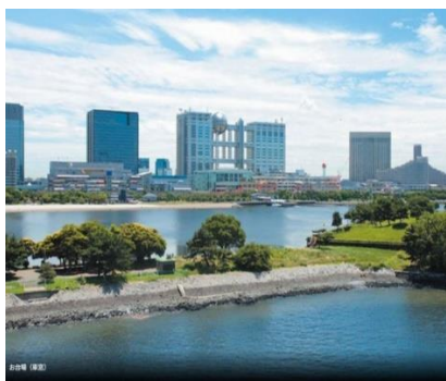
はとバス車窓よりお台場