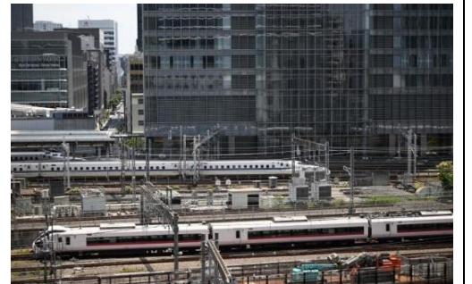
KITTEビル屋上庭園より