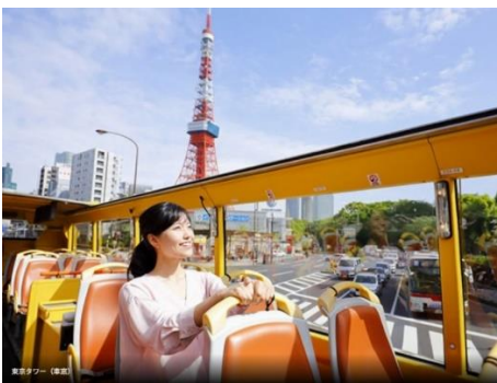
はとバス車窓より東京タワー